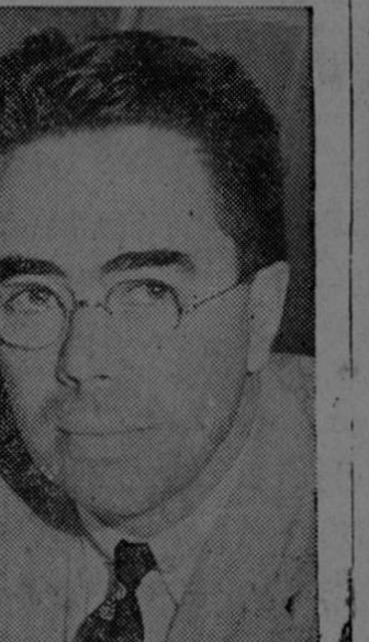
El señor Laves

los ciudadanos. Desde 1943 ha estado al servicio del Negociado del Presupuesto de los Estados Unidos, como consultor administrativo en asuntos internacionales.